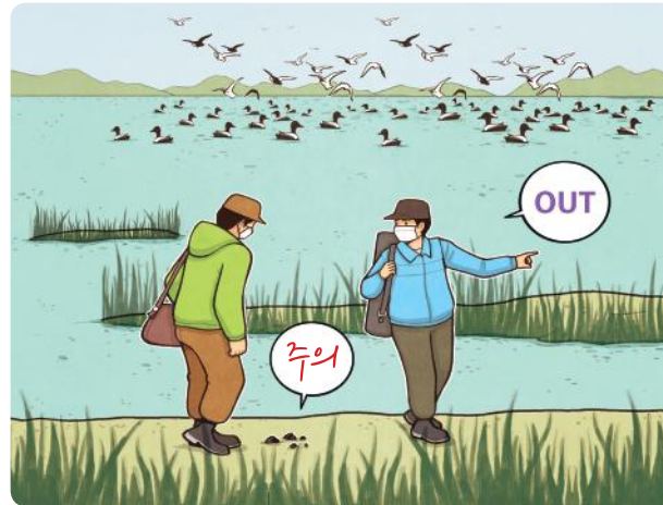
이동시에는 분변, 깃털 등을 밟지 않도록 주의