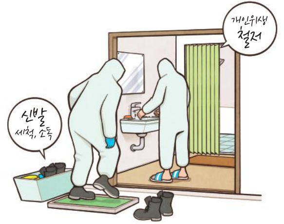
철새서식지에서 벗어날 시 신발세척·소독 및 물과 비누로 손씻기 등 개인위생 철저

※ 일회용 보호복(방역복 등) 착용 권장(일회용 물품 폐기, 나머지 세척)