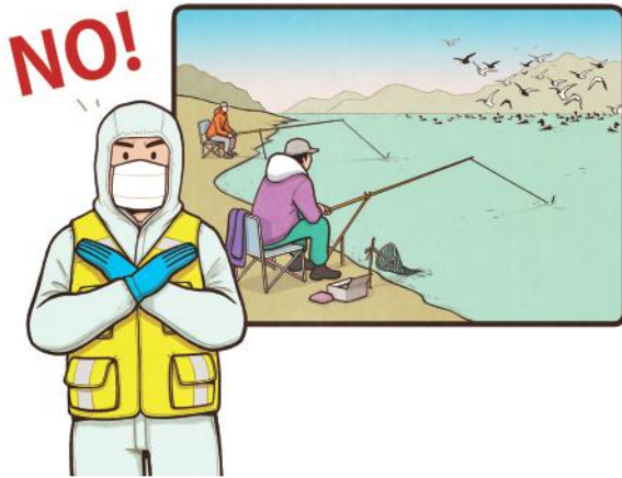
저수지, 하천 등 철새가 무리지어 있는 지역 출입 자제 및 시 발생지역에서 낚시 금지