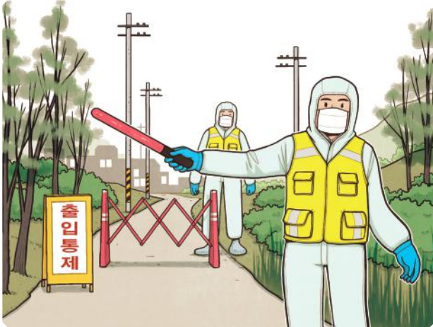
시 발생으로 인한 '출입통제' 지역 출입 금지