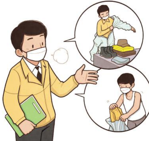
여벌의 활동복, 신발, 신발커버, 모자 등 준비 활동 후 탈의 및 비닐로 밀봉

※ 일회용 보호복(방역복 등) 착용 권장(일회용 물품 폐기, 나머지 세척)