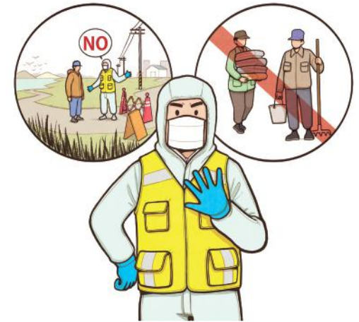
철새서식지 출입 후 가금(닭, 오리 등)농가 방문 금지 및 관련 종사자(농가 종사자, 사료·분뇨 운반자 등) 접촉 금지